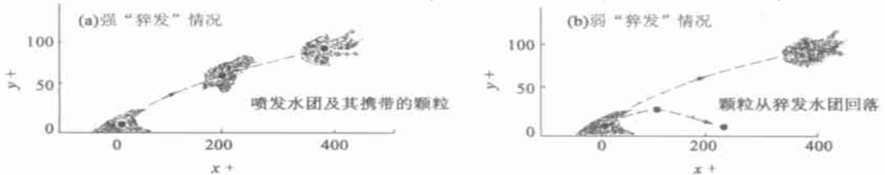
图 2 颗粒与猝发水团的相互作用示意图

随着湍流理论和试验的研究进展,人们认识到床面附近的湍流“猝发”与泥沙颗粒的扬起有着密切联系。Sumer 和 Deigaard [6] 对床面附近颗粒与湍流的相互作用作了较细致的实验研究,认为较强的猝发水团是直接携带颗粒上扬的重要动力。但一般情况下,猝发水团对颗粒的作用主要限于近床层很小的范围内,从床面喷发而出的猝发水团可直接携带颗粒跃起,并在很短距离内,将动量传递给颗粒,此后,颗粒的运动迅速与猝发水团失去相关(图 2)。而颗粒仍可以较大的速度继续上扬,如遇到上层水流的大尺度紊动水团,可保持颗粒继续作悬浮运动。由此说明,紊动猝发作用是颗粒扬动的一种重要机理。但过去的描述比较粗略,仅宏观地描述为,床面低速水流扫荡床面,并将颗粒从床面带起,且在具体分析时还是将猝发作用概化为水流对颗粒的脉动上举力,与水流对颗粒的时均上举力联合平衡沙粒的水下重力后,颗粒即从床面扬起。这种描述总体上讲,表述了紊动猝